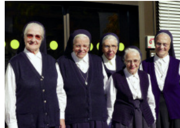
Abschied Die letzten fünf Schwestern haben Rankweil verlassen.

An diese Zukunft glauben wir Schwestern, obwohl wir in der deutschsprachigen Region immer weniger und älter werden. Wir glauben, weil wir wissen, dass uns ein Auftrag zugedacht ist im großen Heilsplan Gottes. Wir und die uns angeschlossenen Mitglieder des Vorarlberger Kreises glauben fest daran, dass wir jetzt dran sind – wie die kleine Gruppe