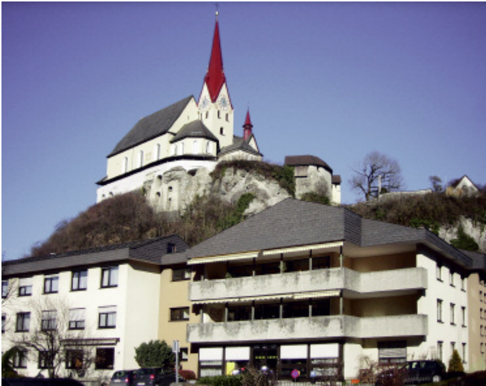
Herz-Jesu-Heim Das Haus der Schwestern unter der Wallfahrtskirche von Rankweil.

104 Jahre lebten und arbeiteten die Anbeterinnen des Blutes Christi in Rankweil in Vorarlberg. Die personelle Situation zwingt sie nun, diese erste Niederlassung im deutschsprachigen Raum zu schließen.